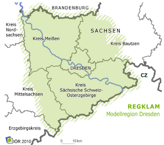
(Abbildung 1) REGKLAM-Modellregion Dresden