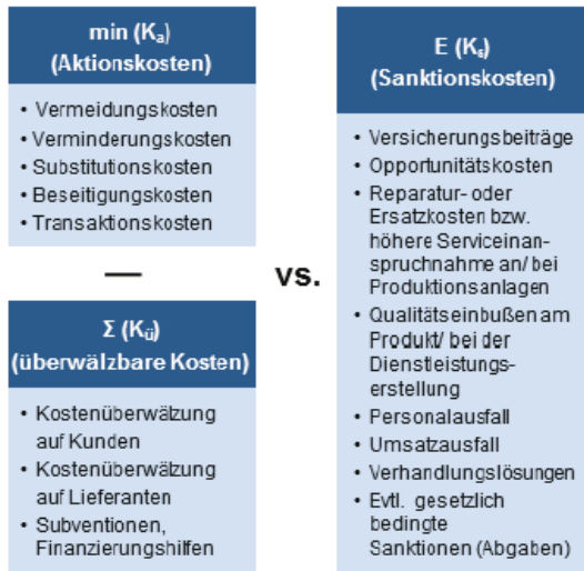
(Abbildung 5) Ökonomisch-Ökologischer Nettoeffekt