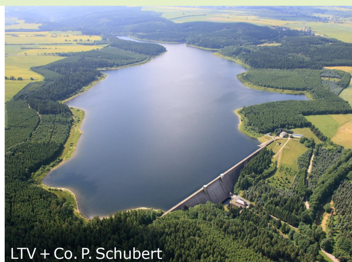
LTV + Co. P. Schubert