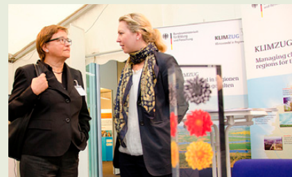
KLIMZUG auf dem IW-Gremientag

Ein zentrales Anliegen des KLIMZUG-Begleitprozesses im Institut der deutschen Wirtschaft Köln (IW Köln) besteht darin, die Ergebnisse aus den Verbundprojekten sowie der KLIMZUG-Begleitforschung zur Anpassung in Unternehmen und Kommunen in der Öffentlichkeit zu präsentieren. Dabei kommt den Akteuren aus der Wirtschaft eine besondere Bedeutung zu. Um dieser Rolle gerecht zu werden, nutzt das Team im Begleitvorhaben außer externen Veranstaltungen, Vorträgen und Publikationen auch IW-Veranstaltungen, an denen überwiegend Vertreter aus Unternehmen und Wirtschaftsverbänden teilnehmen. Basierend auf den IW-Untersuchungen konnte das Thema Anpassung beispielsweise bei dem „Wirtschaftspolitischen Treffen“ mit Volkswirten aus den wesentlichen Verbänden der Privatwirtschaft diskutiert werden. Außerdem war das Team am diesjährigen „IW-Gremientag“ mit einem Bücherstand und einer Poster-Präsentation aktiv beteiligt. Im Gespräch mit Vertretern aus Unternehmen und Wirtschaftsverbänden konnte auf die KLIMZUG-Ergebnisse näher eingegangen und mit den Teilnehmern diskutiert werden.