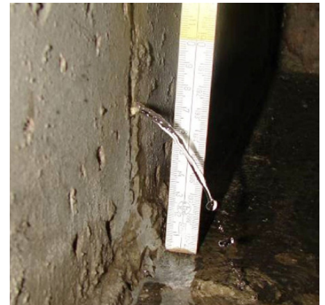
Wassereintritt in Tiefgarage nach Grundwasseranstieg durch Starkregen

Auf dieser Grundlage werden für die wichtigsten Einwirkungen Analyseverfahren entwickelt, mit denen die Verletzlichkeit des baukonstruktiven Gefüges besser beurteilt werden kann. Im Ergebnis der REGKLAM-Forschungsarbeit wird ein Katalog mit bau- und haustechnischen Anpassungsmaßnahmen zur Verfügung gestellt. t.naumann@ioer.de