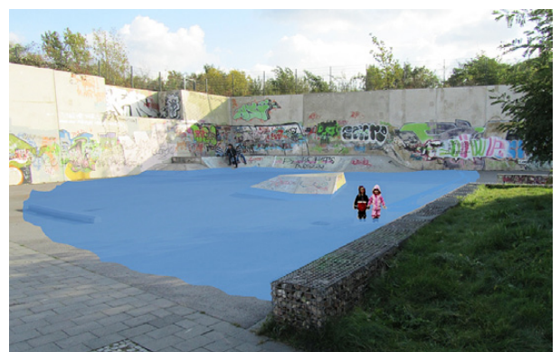
Skaterfläche als innerstädtischer Rückhalteraum