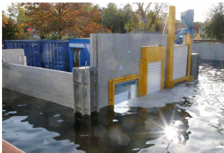
Starkregen-Schott im Test

Doch Privatleute und Unternehmen können nun ihre Gebäude vor derartigen Überraschungen durch Starkregen oder Überschwemmungen schützen. Das in Neuwied am Rhein ansässige Unternehmen AQUA-STOP Hochwasserschutz GmbH hat im Rahmen von KLIMZUG-NORD Teile seiner angebotenen Hochwasserschutzsysteme zu intelligenten, automatischen Systemen weiterentwickelt. Ein sogenanntes Starkregen-(SR)-Schott